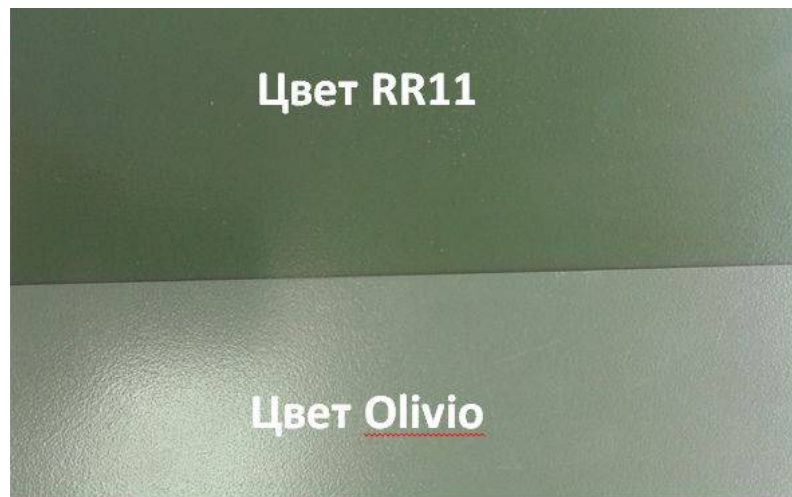
RR 11 (зелёная хвоя) и OLIVIO (оливковый).