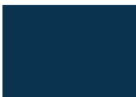
RR 35 Синий